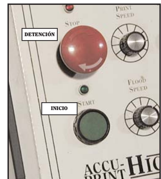
Diagrama 3. Ubicación de los botones de DETENCIÓN y de INICIO.